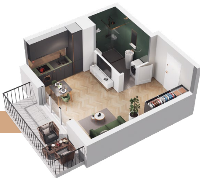
mieszkanie 29 m 2