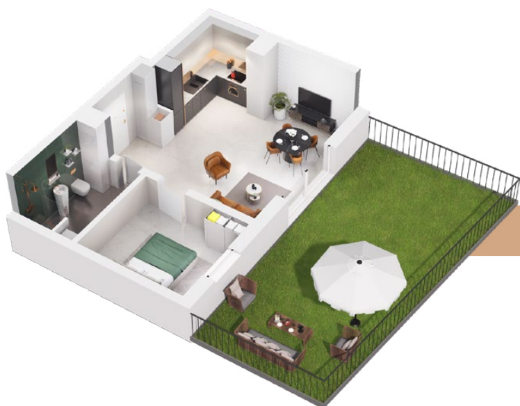
mieszkanie 42 m 2