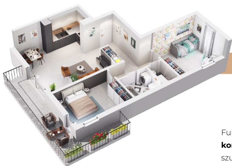
mieszkanie 73 m 2

Kameralne mieszkania o powierzchni od 27 do 87 m 2 będą wyposażone w prywatne ogródki lub przestronne balkony, które staną się zieloną przestrzenią do odpoczynku mieszkańców.